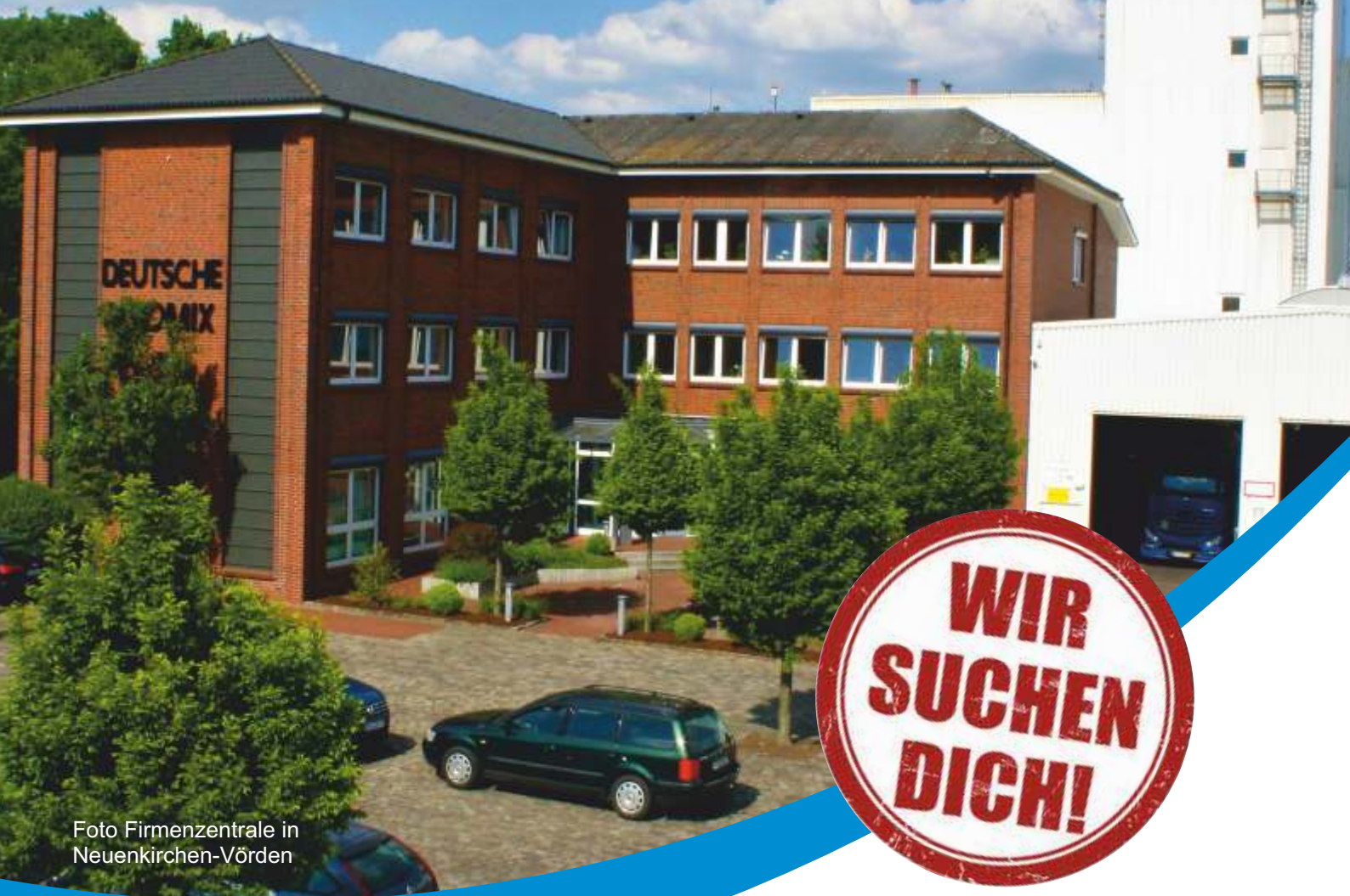
Foto Firmenzentrale in Neuenkirchen-Vörden